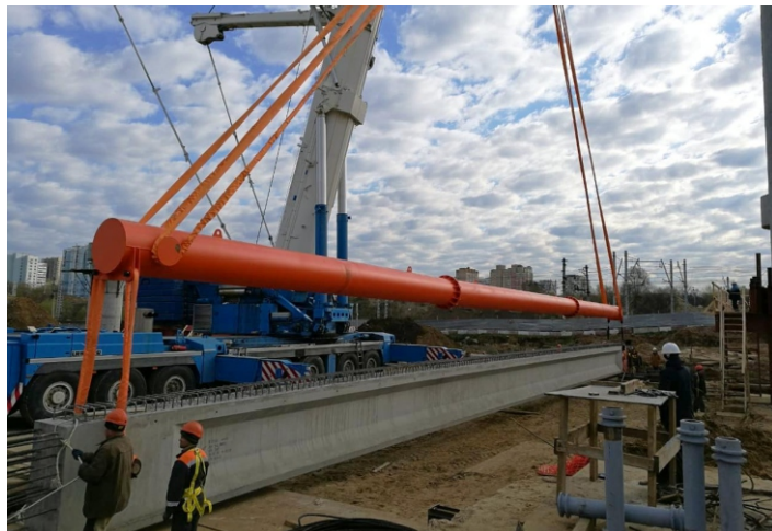
Траверса линейная с подъемом за края грузоподъемностью 60,0 тонн и длиной 31,6 метров для строительства развязки в Москве.