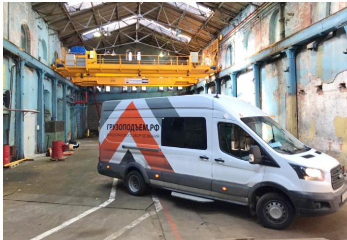
Кран мостовой опорный двухбалочный с электроприводом грузоподъемностью 10,0 тонн и длиной пролета 12,9 метров для предприятия в Санкт-Петербурге.