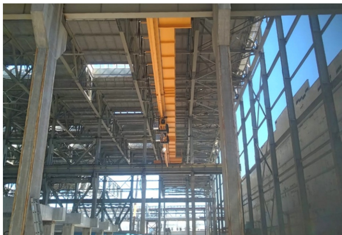
Кран мостовой опорный однобалочный с электроприводом грузоподъемностью 10,0 тонн (5,0 + 5,0) для предприятия в Верхней Пышме.