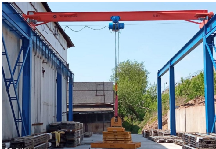
Кран мостовой опорный однобалочный с электроприводом грузоподъемностью 5,0 тонн и длиной пролета 10,0 метров в комплекте с подкрановой эстакадой для предприятия в Москве.