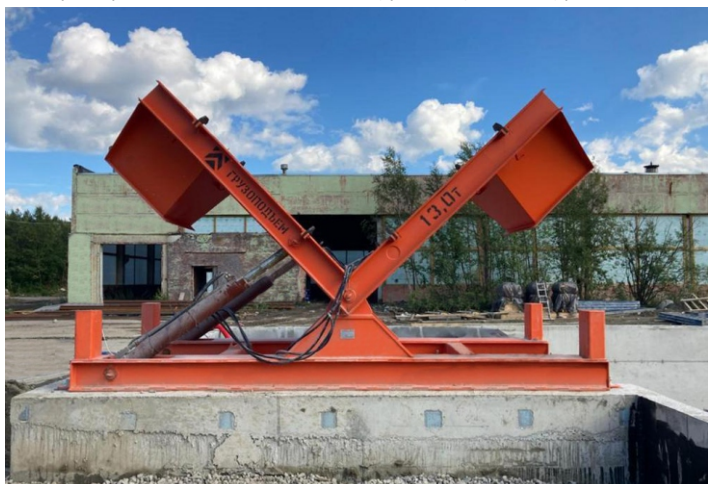
Кантователь для рулонов с гидроприводом грузоподъемностью 13,0 тонн для предприятия в Мурманске.